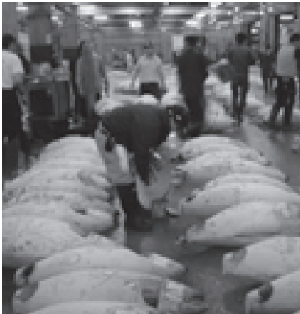
marché aux thons

Il en ressort qu'en 2000, la pêche ne fournit que 24 % du tonnage total de chair animale produite, et seulement 9 % du tonnage global de productions animales (chair + lait + œufs). Pour des raisons que nous ne détaillons pas mais qui figurent dans l'article indiqué, ces chiffres surestiment la part de la pêche dans la fourniture de chair consommable.